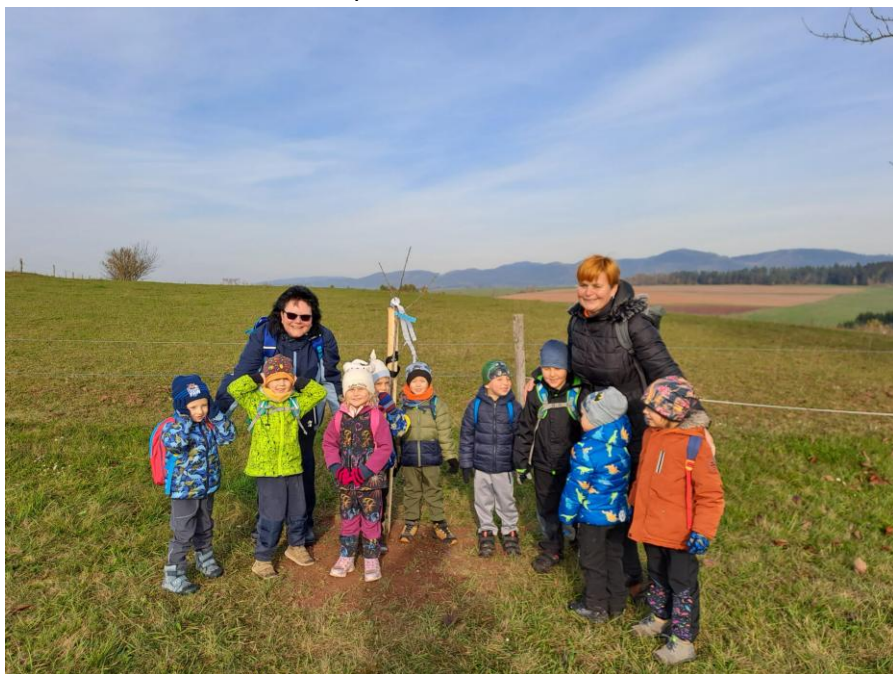
MŠ při DD Broumov