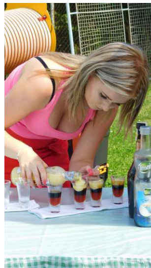
SŠHSS Teplice n. Metují