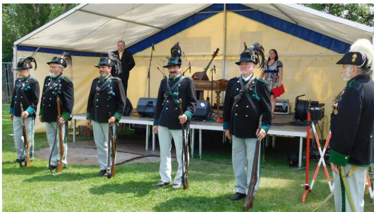
Ostrostřelci z Police n. Metují