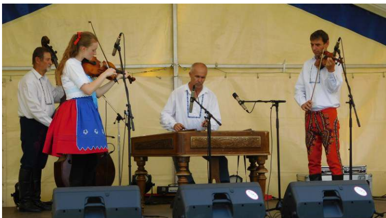
Cimbálová muzika z Moravy