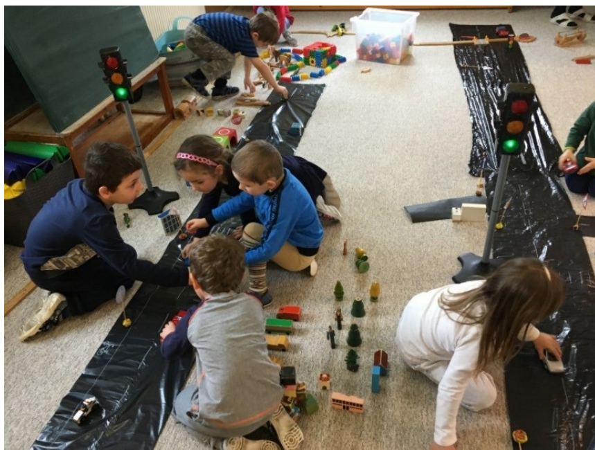
Naši Kutilové se vyznají v dopravním provozu, poznávají dopravní značky a dokonce budují silnice, dálnice a stezky.