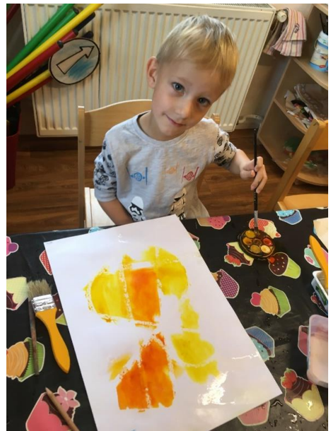
Umělec v akci