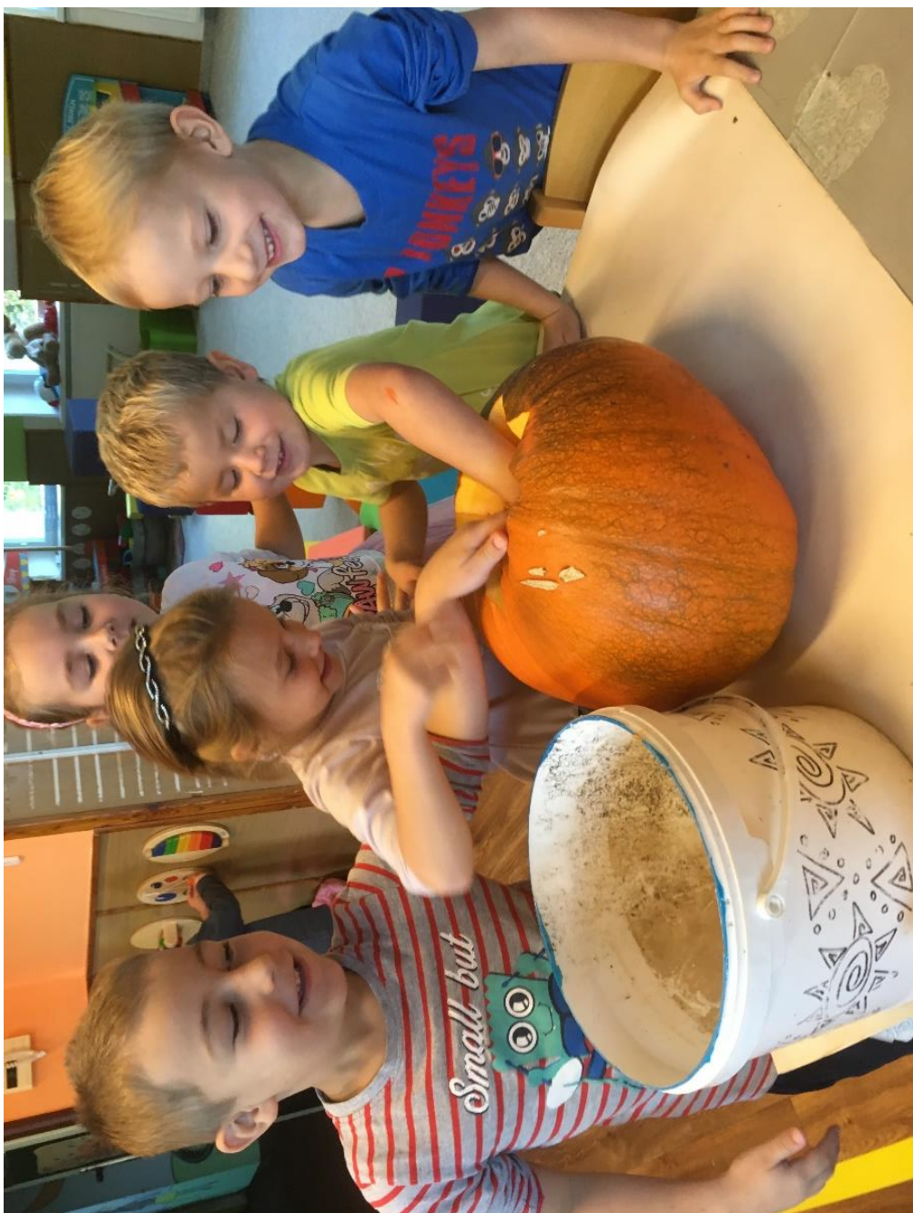
A tady bylo opravdu veselo