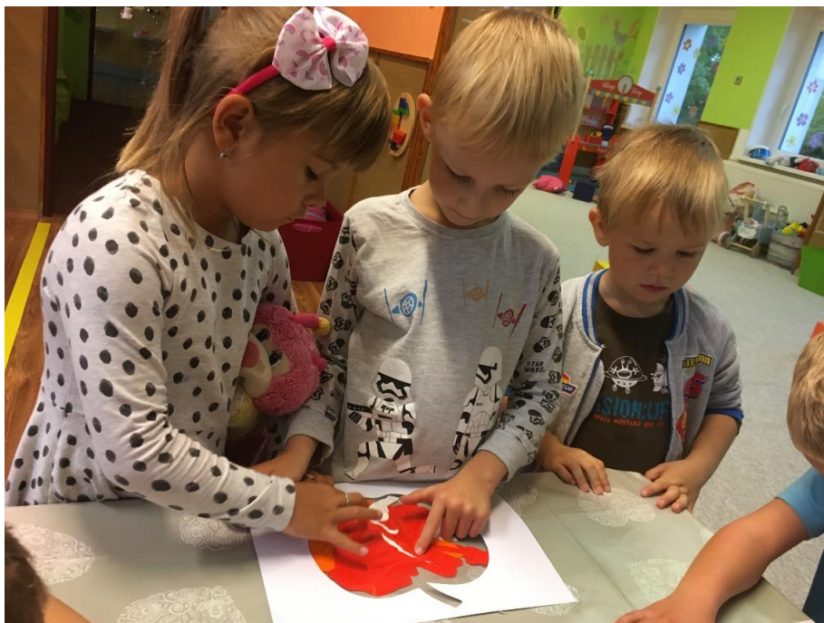
Práce s barvičkami