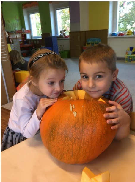
Kontrola kvality materiálu