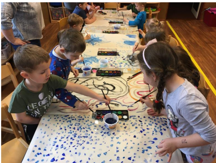
„MALOVANÝ DÉŠŤ A BOUŘKA V PODÁNÍ NAŠICH MALÝCH UMĚLCŮ “