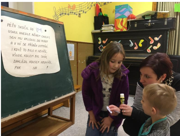
„VÁNOČNÍ OBRÁZKOVÉ ČTENÍ S RODIČI “