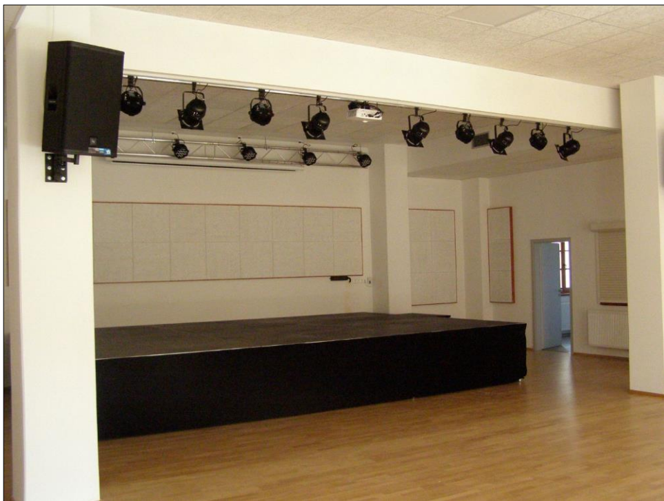
Polyfunkční komunitní centrum Hejtmánkovice – sál s podiem.