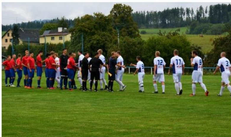
Fotbalisté Hejtmánkovic (v bílem) na podzim porazili doma Opočno 2:1.

Dopad mít bude. Jednak může nastat problém se sponzory, neboť spousta firem bude mít vzhledem k situaci omezené rozpočty, a jednak také naše obec bude muset více šetřit.