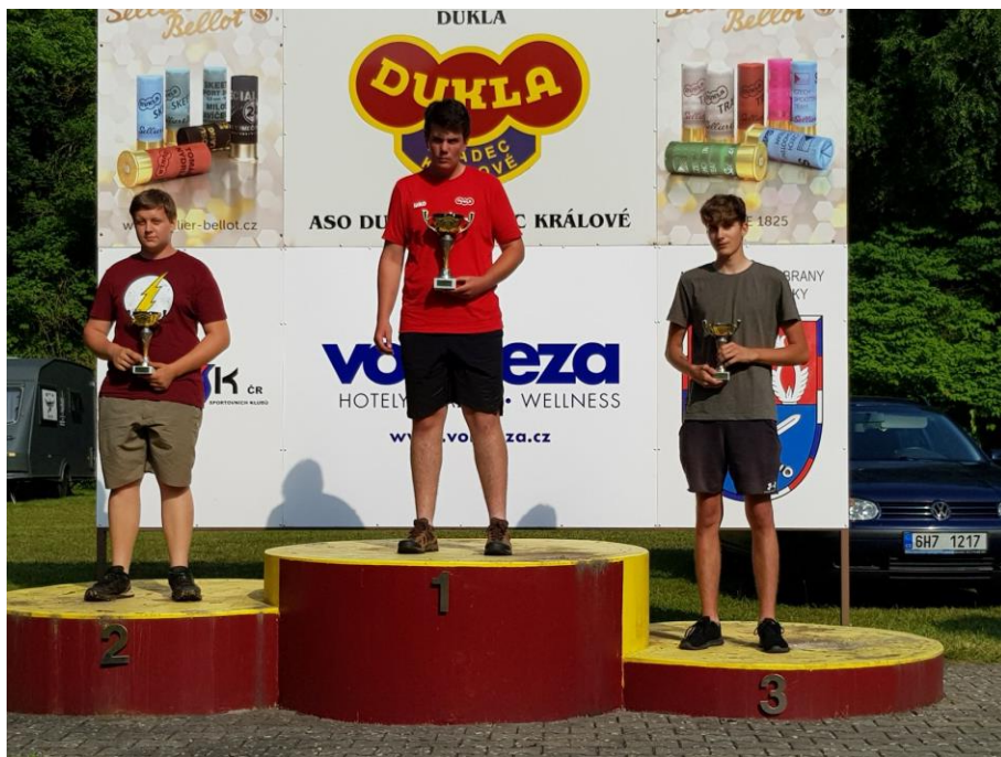
III. kolo KZR Hradec Králové Mistrovství ČR Brno